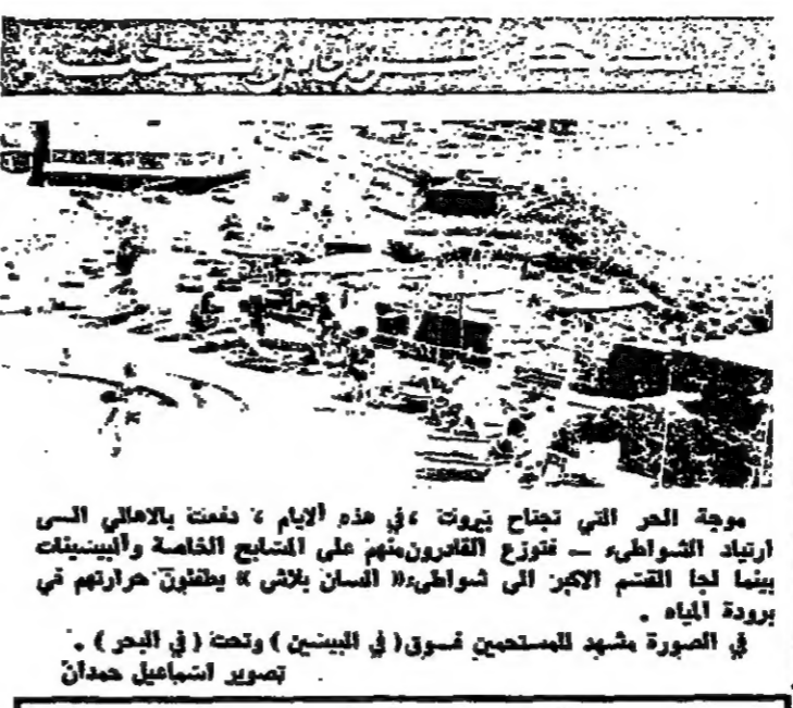
موجة الحر التي تجتاح بيروت ، في هذه الأيام ، نمت بالاعمال التي ارتيد التواطير - فنزوح الثمنون منهم على المصالح الخاصة والبيوتات بينما لجأ القسم الاكبر الى شواطيء «السان بلاش» يتفوق حرارتهم في برودة المياه . في الصورة مشهد للمتصحين لسوق في البيوتات (تحت في البحر) .

اليمن يحاول تعطيل الانتخابات الاسبانية آخر استفاء يرجح فوز اليمين - الوسط مع ارتفاع عدد مقاعد الشيوعيين والاشتراكيين تسمى حوالي خمسة وعشرين حزبا شينيا او التفاه تسياسيا يوم الاربعاء المقبل الى مكتب اصوات ما يزيد على ٢٢ مليون ناخب اشينيا . وقد تضمنت حركة اقصي اليسار المنوطة من التفاه الى الانتخابات بصورة مباشرة نظرا لمسلم شريعنا سواء كانت حركة لاصي اليسار المروي او الشيوعيين في ثلاثة ائتلافات كبرى هي : جبهة اتحاد العمال التي تتألف من الرابطة الشيوعية الثورية والشيوعية ومنظمة اليسار الشيوعي الموية ومنظمة العمل الشيوعي . والخبرا الجبهة الديمقراطية وتضم في اقلها حزب العمل الشيوعي . كما ان هذه التفتلات لم تكن من تشكيل مجموعة واحدة نظرا لعدة اختلافات ايدولوجية لها برامج وتشابهة الى حد كبير وتكون جميعها حول تفكيرين رئيسيين هما : افضاء الديمقراطية على جميع الاجزاء الشعبية والمعروف العام . اما بالنسبة لاصي اليمين فهناك ثلاث قوى تشكل في التفاه من ميادين لراكت وهي حزب اللاشيوع الاصلي الذي يترجمه رينونو فرانز كوستا ويكون اساسا من قدامى المقاتلين من مصر فرانك الذين اشتركوا في الحرب العالمية ثم حلقت جزوية انطونين التي تضم الكتلة والقرنين ايدولوجيين فترج فراكتي في الكتلة . واما خاترا لونا وحركة تحالف ١٨ كليون الوطني الثتان تطهران الحركة بالنسبة لاصي اليمين في اشينيا .